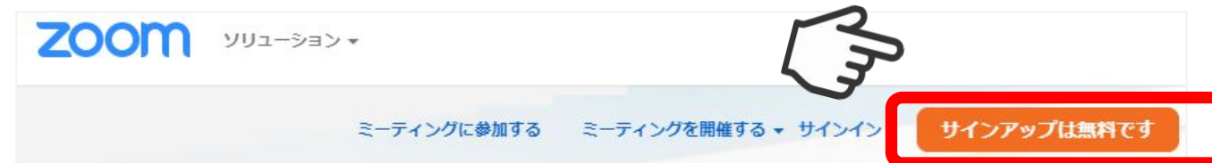
画像②(Zoomのホームページ画面)

Zoomのインストール後に、ご自身のアカウントの作成をしてください。 インストール後に表示される画面で「ミーティングに参加」をクリック 画像① ）、 または、Zoomのホームページにアクセスして頂き、「サインアップは無料です」のボタンをクリック 画像② し、 表示された画面で必要情報を入力し、アカウントを作成してください。