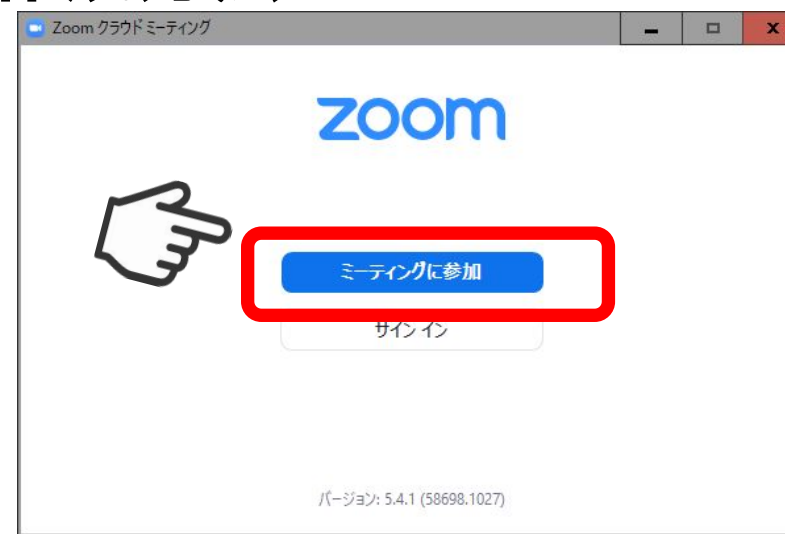
画像①(インストール後に表示される画面)