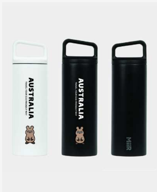
ボトルは白と黒の2種類